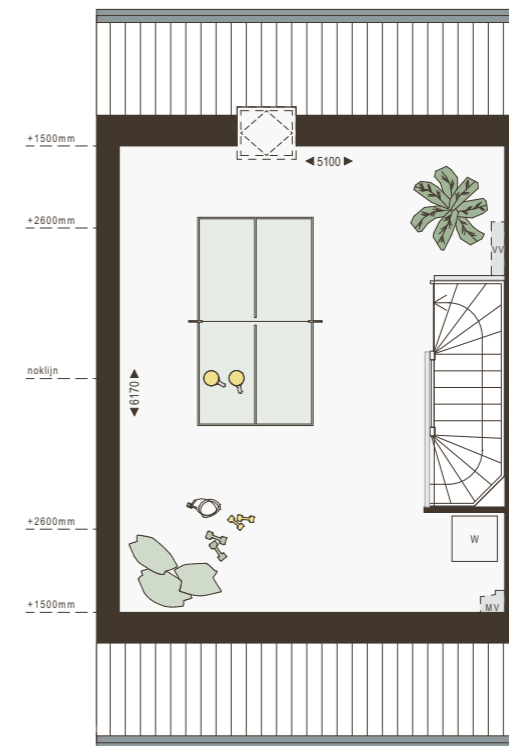
2e verdieping 1:100