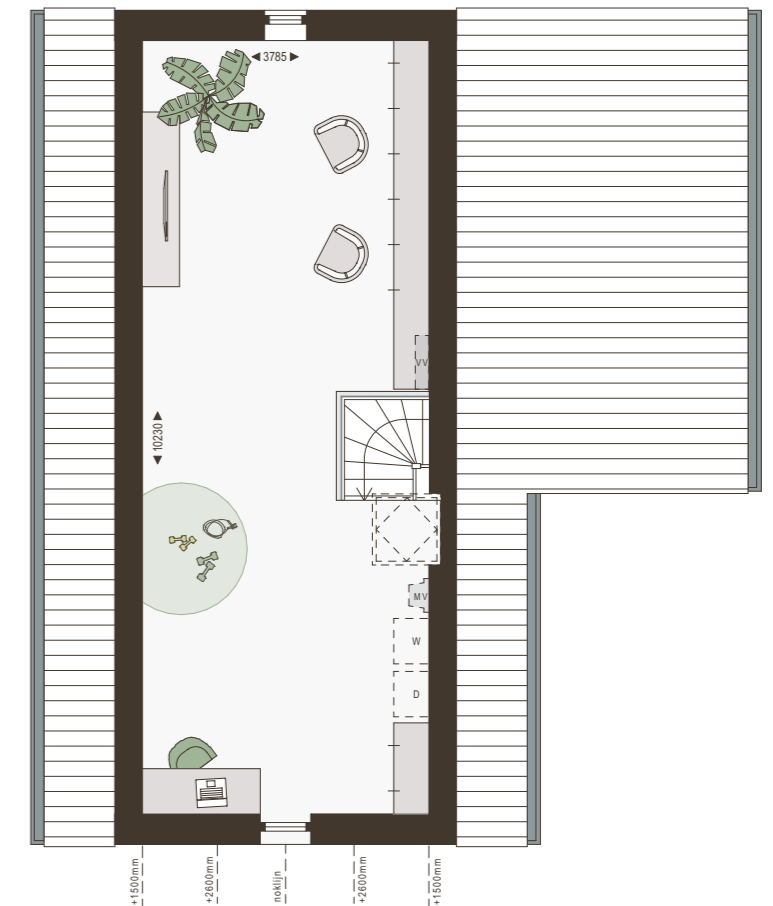
2e verdieping 1:100